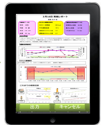
ご利用者様向け フィードバック帳票作成

運動負荷試験、利用者様基本データ登録、運動前後に実施する簡易問診、利用者様向けフィードバック帳票の作成等、運動評価サービスに必要な機能をトータルサポートいたします。