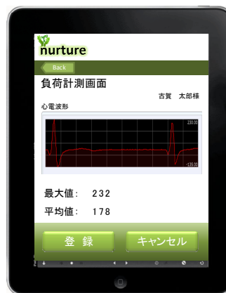
リアルタイム運動負荷評価