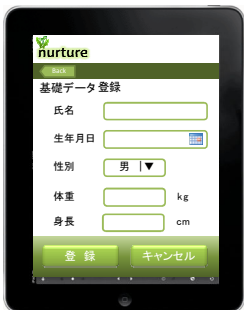
ご利用者様基本情報登録